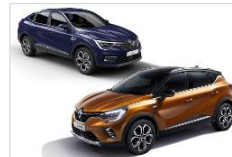
XM3 & CAPTUR Light Ver LIL & HJB (2020)