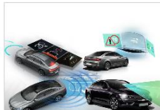
ADAS 전차종 (2019)