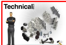
MECHANIC New Cotech Course(정규과정)